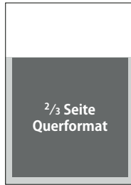
2/3 Seite, quer

s/w 1870 € 2-farbig 2280 € 4-farbig 2880 €