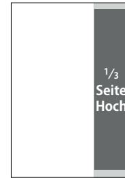
1/3 Seite, hoch

S: 58 × 254 mm A: 70 × 297 mm (76 × 303 mm)