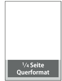
1/4 Seite, quer

S: 185 × 61 mm A: 210 × 78 mm (216 × 84 mm)