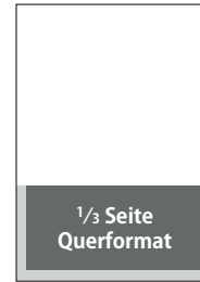
1/3 Seite, quer

s/w 935 € 2-farbig 1140 € 4-farbig 1440 €