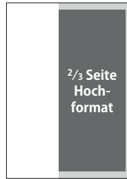
2/3 Seite, hoch

s/w 1247 € 2-farbig 1520 € 4-farbig 1920 €